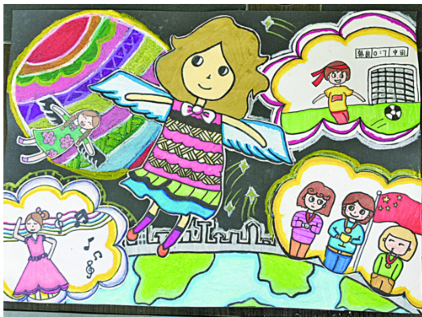
辉埠小学六(1)班 曹林菲 指导老师 徐雯婷

黄猫警长破的案可不止这个啊,我的好多疑案都是它帮忙破的呢!生活中多亏了黄猫警长的陪伴,让我的生活变得更加安宁。